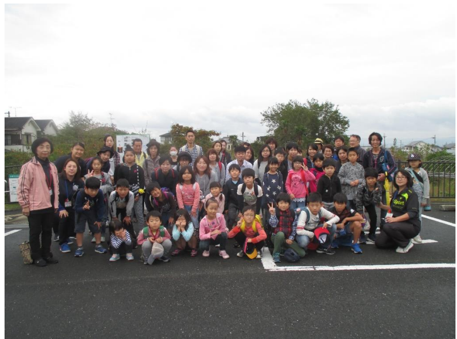
参加お疲れさまでした。