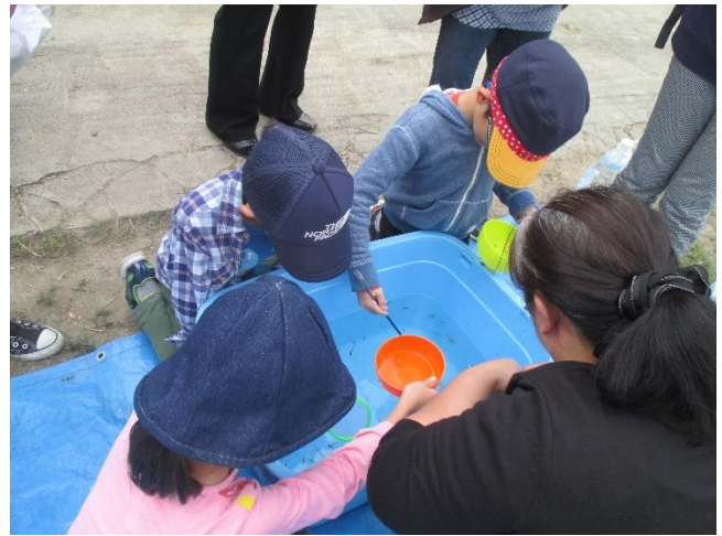
小さいメダカ、上手くすくえたかな。