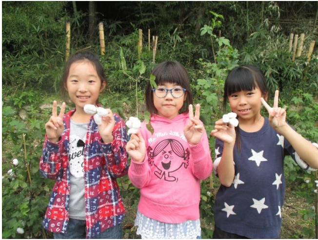
初めての綿摘み、どうでしたか？良かったね。