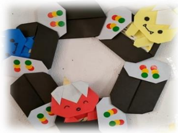
ひまわりクラブも かわいい!

もうすぐ ひな祭り ですね。女の子のすこやかな 成長と健康 を願う、3月3日は「 桃の節句 」という行事です。のびっこの先生がみんなの健康を願って、折り紙で壁面装飾をして下さいました → 節分の巻きずしも、とてもおいしそうに折ってありましたよ ↓